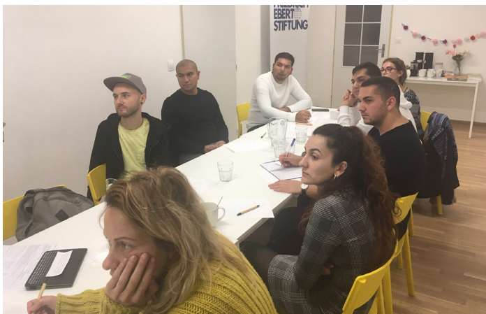
Školenie mladých rómskych lídrov zamerané na time managementu.

Teší nás, že eduRoma je, spolu s ďalšími organizáciami a odborníkmi, súčasťou novej pracovnej skupiny Ministerstva školstva, ktorej hlavnou úlohou je zadefinovať pojem segregácie v školskom zákone tak, aby sa následne darilo zriaďovateľom a školám účinne nadstavovať inkluzívne opatrenia vo vzťahu k rómskym deťom v školskom prostredí. Sme radi, že naše dlhoročné skúsenosti v oblasti desegregácie môžeme postupne premietnuť aj do zmysluplných iniciatív rezortu školstva.