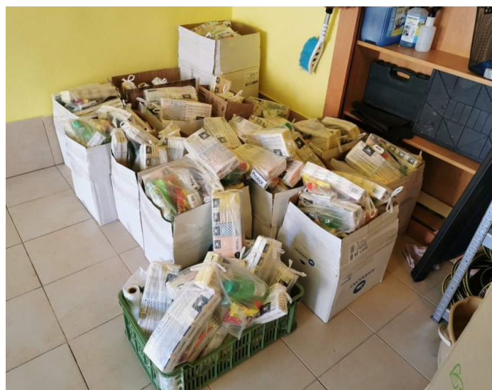
Humanitárna pomoc chudobným rodinám počas pandémie COVID-19.

lupracujeme, v rámci projektu dištančného vzdelávania, ale aj iným, ktorí túto pomoc urgentne potrebovali.