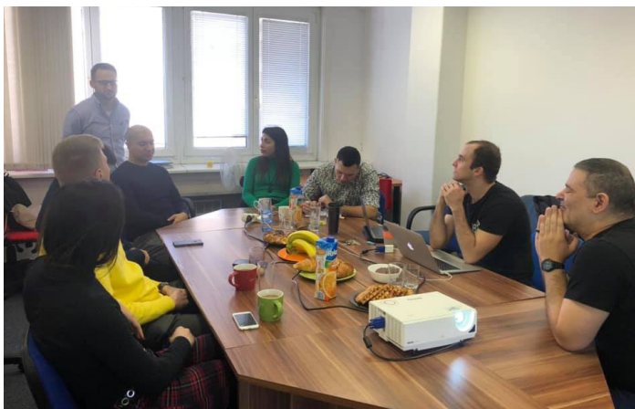
Školenie mladých rómskych lídrov v kritickom myslení.