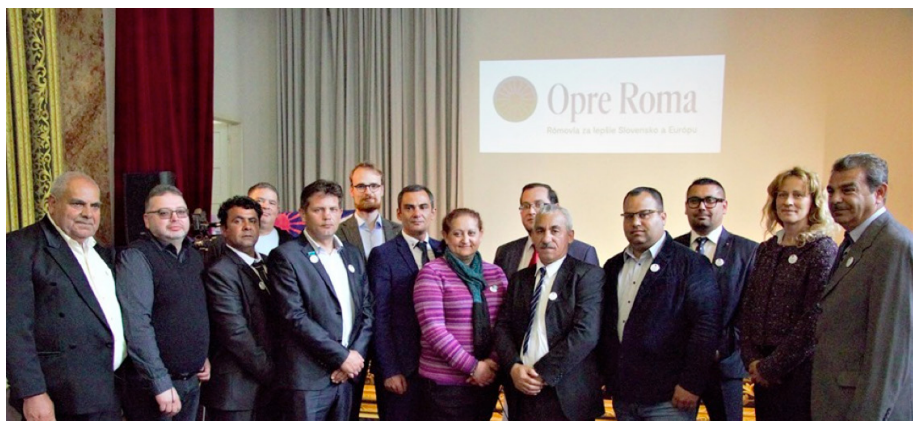
Iniciatíva Opre Roma.

budúcimi rómskymi lídrami. My im v tom pomáhame, organizujeme školenia a semináre a chceme im byť aj v budúcnosti, na ceste za líderstvom, oporou.