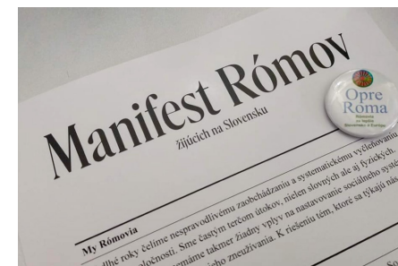
Manifest Rómov žijúcich na Slovensku.