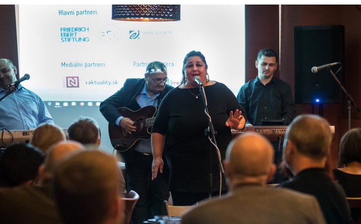
Slávnostný večer Lúčov.