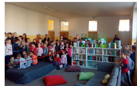
Otvorenie školskej knižnice na ZŠ Jarná v Žiline.

V spolupráci so zástupcami Úradu splnomocnenca vlády pre rómske komunity sme vyškolili prvých lektorov pre tvorbu inkluzívnych vzdelávacích plánov pre materské školy. Spolu s učiteľmi a terénnymi pracovníkmi sme absolvovali veľmi nápaditý, kreatívny a naozaj príjemný deň.