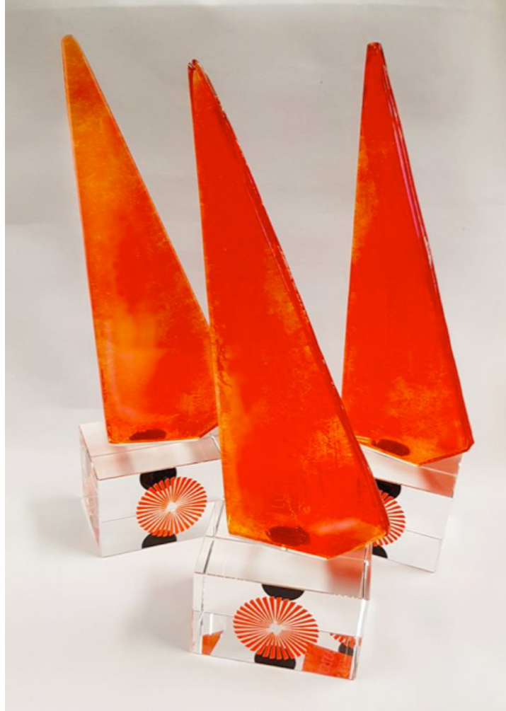
Ocenenie Lúč z tmy.