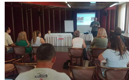
eduRoma vyškolila prvých lektorov pre tvorbu inkluzívnych vzdelávacích plánov.