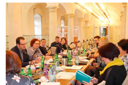
Expertná komisia na pôde Národnej rady Slovenskej republiky.