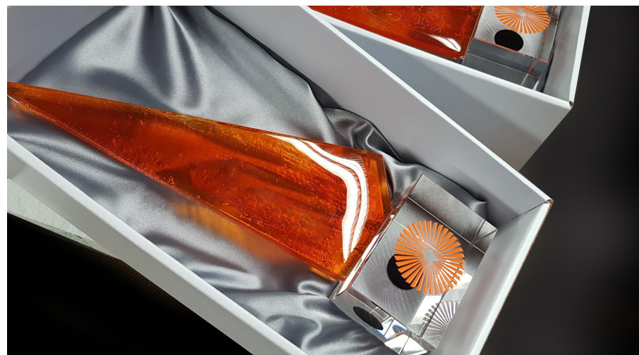
Lúč symbolizuje nádej, ukazuje nám cestu, po ktorej treba kráčať, aby sme nezablúdili.