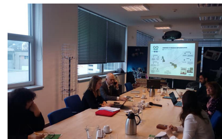
Zahájenie práce Národnej skupiny v rámci projektu InSchool.