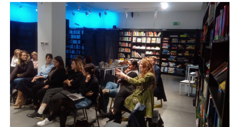
Diskusia na tému Inklúzie rómskych detí od raného detstva.