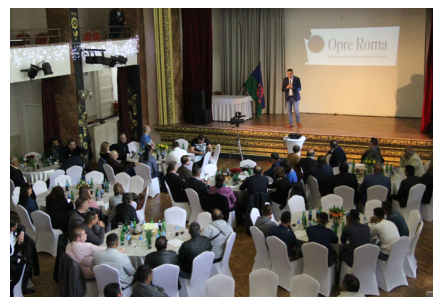
Stretnutie iniciatívy Opre Roma.

Opre Roma je apolitická, neformálna iniciatíva, ktorej zakladajúcimi organizáciami sú: Spoločnými silami za rozkvet Gemera, eduRoma, Záujmové združenie obcí Jekhetane, Romed a REF. V krátkom čase sa nám podarilo pod spoločným Manifestom Rómov žijúcich na Slovensku zjednotiť 16 rómskych starostov (zo 45) a približne 150 rómskych obecných poslancov (zo 400). Manifest tiež podpísalo približne 8000 Rómov a Rómiiek.