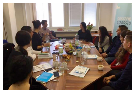
Druhé stretnutie so skupinou mladých rómskych lídrov.