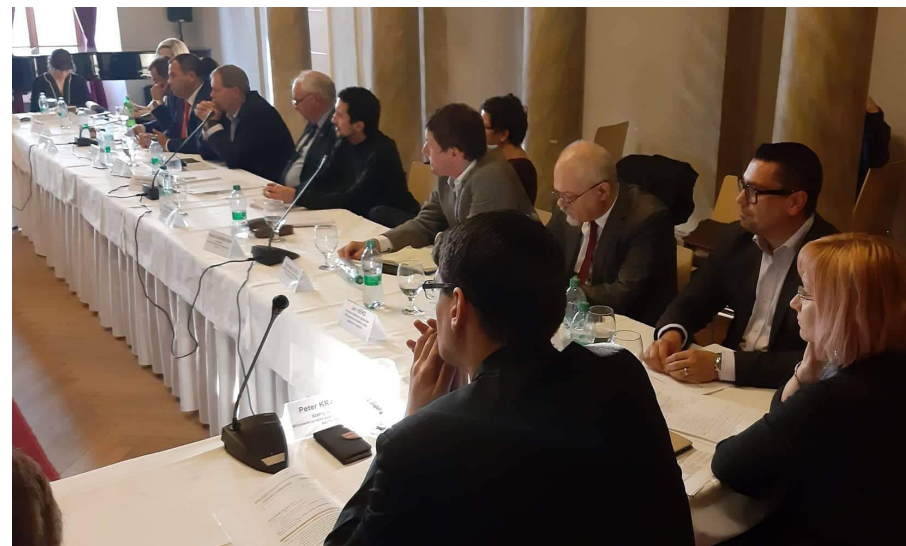
Stretnutie s eurokomisárkou Vierou Jurovou.

Presadzujeme nové, objektívnejšie kritériá posudzovania detí zo sociálne znevýhodneného prostredia. Počty detí ohrozené chudobou nám v budúcnosti budú narastať. Zástupcovia eduRoma, Centra pre výskum etnicity a kultúry (CVEK) a oz Eqvity, diskutovali s predstaviteľmi Ministerstva škol-