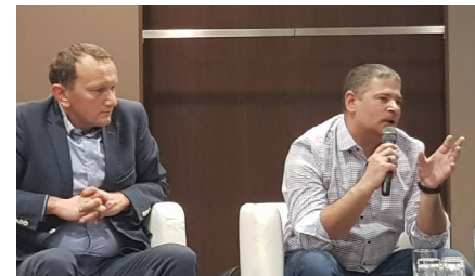
Diskusia o zavedení povinnej predškolskej prípravy.