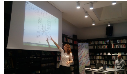
Diskusia na tému Inklúzie rómskych detí od raného detstva.