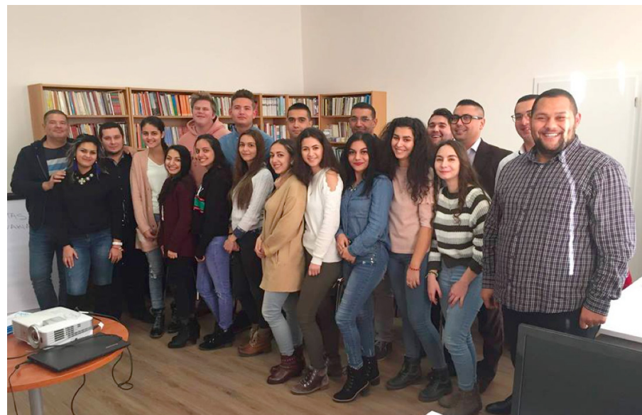
Stretnutie mladých rómskych lídrov.