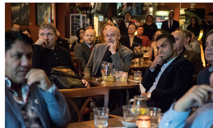
Slávnostný večer Lúčov.