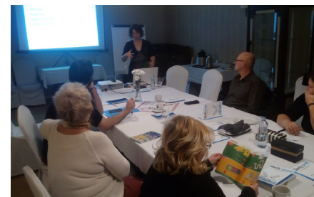
V Žiline pracujeme s učiteľmi zo siedmich základných škôl.