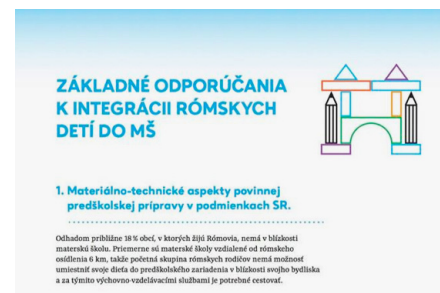
Základné odporúčania k integrácii rómskych detí do MŠ.