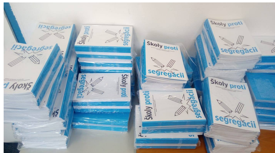
Tlačená verzia metodickéj príručky Školy proti segregácii.

Podarilo sa nám obstať vo veľkej konkurencii a ako jedna z mála organizácií sme získali Nórske fondy na výskumný a advokačný projekt zameraný na zavádzanie povinnej materskej školy. Tento projekt realizujeme v spolupráci s výskumníčkami s SGI a s Úradom splnomocnenca vlády pre rómske komunity.