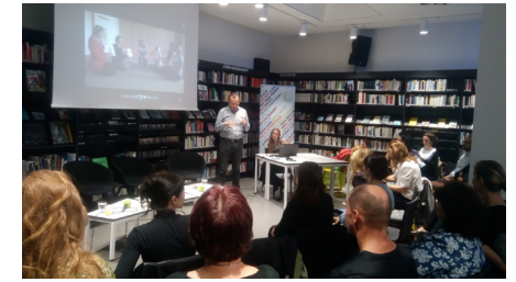
Diskusia na tému Inklúzie rómskych detí od raného detstva.