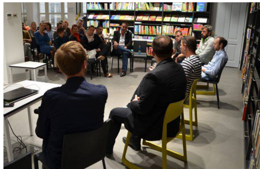
Diskusia o tom, aké je to patriť na Slovensku do menšiny.

Kampaň upozorňuje na diskrimináciu v prístupe k zamestnaniu – prieskumy dokázali, že uchádzači s rómskym priezviskom nie sú pozývaní na pracovné pohovory. Kampaň naštartovala organizácia Divé maky a my im v tom s radosťou pomáhame.