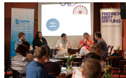
Diskusia o zavedení povinnej predškolskej dochádzky.

Diskutovali sme s poslancami NRSR, ako by sa mohli zlepšiť podmienky vzdelávania rómskych detí. Hlavnými prierezovými problémami, ktoré sme v diskusii postupne otvorili boli aj problémy segregácie a neschopnosť uviesť do praxe inkluzívne vzdelávanie pre všetky deti. Výsledkom diskusie bol prísľub spolupráce s demokratickými poslancami a poslankyňami naprieč politickým spektrom spolu so zástupcami mimovládneho sektora.