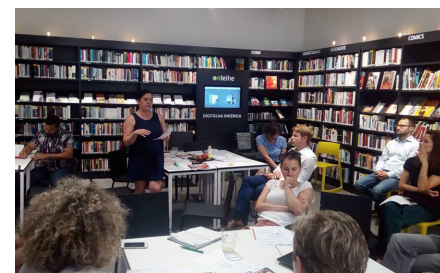
WORLD CAFÉ na tému integrácie rómskych detí do materskej školy.