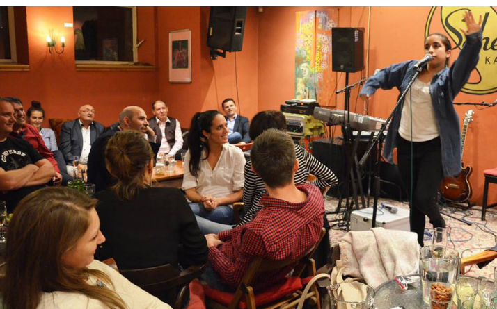
Oslava 5. výročia organizácie eduRoma.