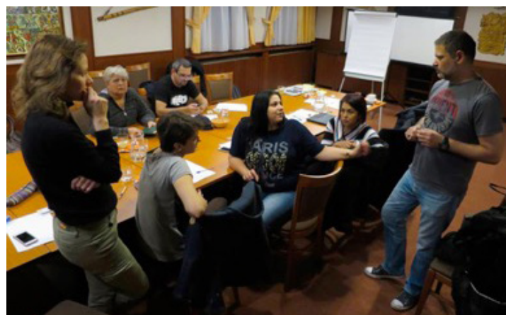
Neformálne stretnutie rómskych organizácií.