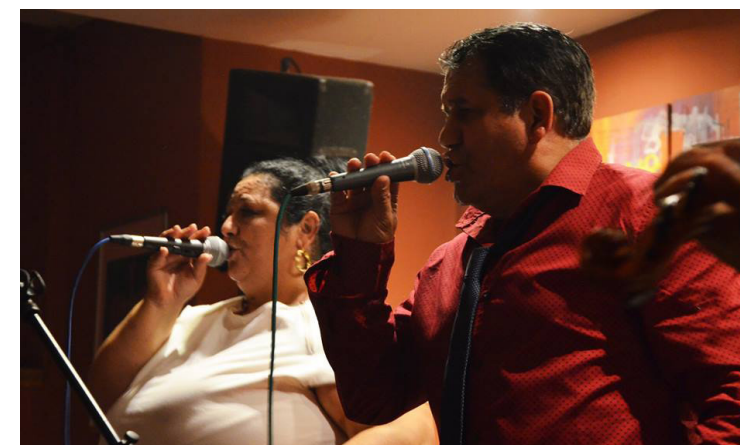
Na oslave zahrali a zaspievali aj Sendreiovcí.