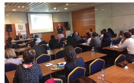
Konferencie o probléme segregácie rómskych detí v školách.