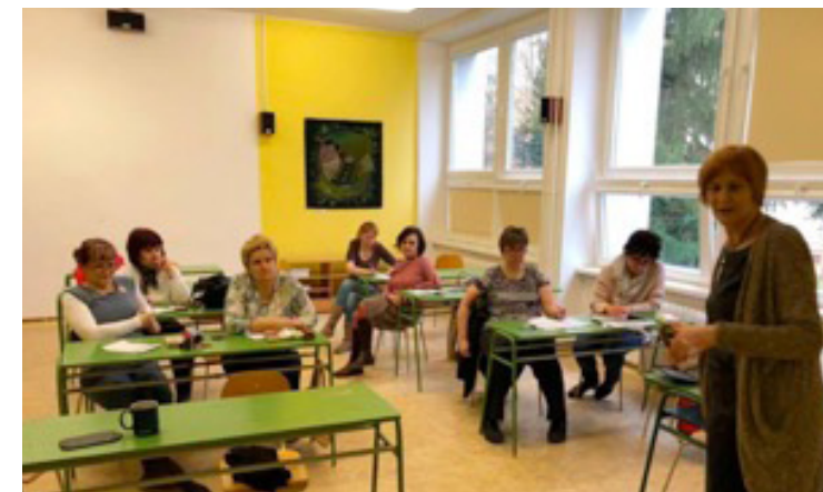
Praktické stretnutie k čitateľskému programu „Podme spolu čítať...“