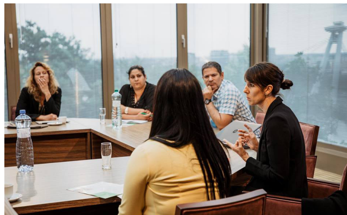
Zuzana Neupauer diskutuje s poslancami Národnej rady Slovenskej republiky.