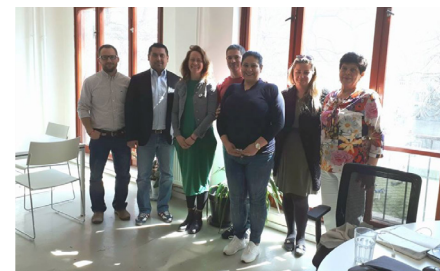
Stretnutie koalície rómskych vzdelávacích MVO k téme segregácie vo vzdelávaní.