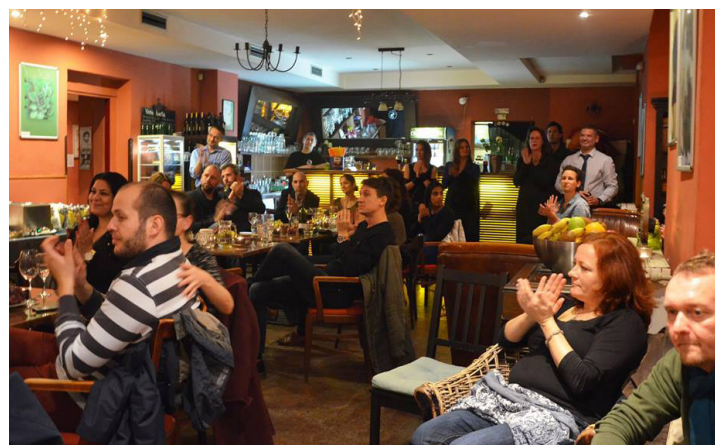
Oslava 5. výročia organizácie eduRoma.