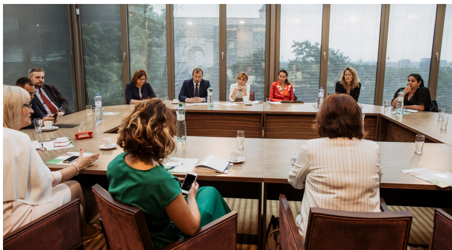
Diskusia s poslancami Národnej rady Slovenskej republiky.

záciami, sme zorganizovali stretnutie, kde hlavnou témou bola príprava zavádzania povinnej 1-ročnej predškolskej dochádzky pre všetky deti na Slovensku. Ako ju zaviesť tak, aby sa v nej rómske deti „nestratili“, aby naozaj prispela k ich lepšej pripravenosti a úspešnému zaradeniu do siete základných škôl, to je úloha, na ktorej pracujeme.