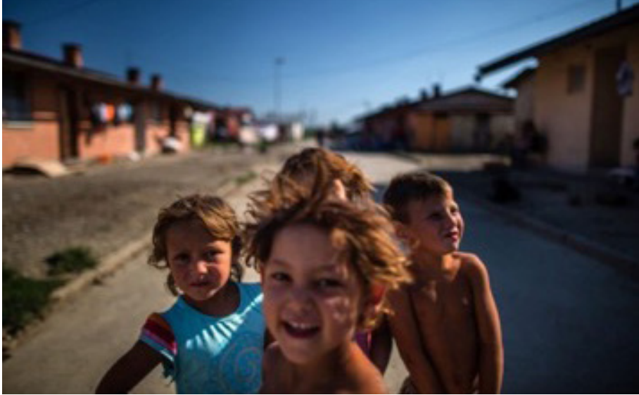
Čo by pomohlo, aby rómske deti začali navštevovať materské školy?

V rámci mediálneho programu komunikujeme s médiami a vo verejnom priestore diskutujeme závažné témy, ktorým sa eduRoma venuje. Prináša so sebou prácu s médiami a verejnou mienkou. Cez médiá podporujeme naše advokačné aktivity, senzitivizujeme verejnú mienku a meníme stereotypný obraz o Rómoch.